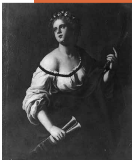
Antiveduto Gramatica, la musa Euterpe , Torino, Palazzo Chiablese

della Maddalena al Sepolcro di San Pietroburgo, a quelli delle Muse di Palazzo Chiablese a Torino, a quello dell'Elenadi Eger (Museo del Castello Istvan Dobo), tutte opere databili negli anni del terzo decennio 1 . La veste della donna è tempestata di simboli che somigliano a quelli zodiacali, mi domando se il pittore li abbia inseriti più come decorazione che come rimandi a misteriosi significati. La cornice dipinta che circonda l'ovale, e il cartiglio in basso che indica il nome del personaggio raffigurato, lasciano pensare che la tela facesse parte di una serie di altre Sibille simili a questa, di cui al momento non abbiamo traccia.