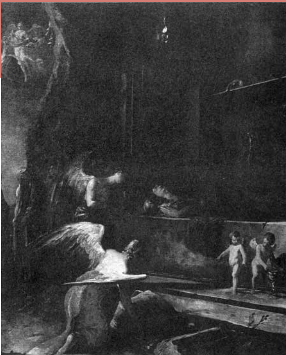
Johann Heinrich Schöpfung, Morte di Santa Maria Maddalena , Freising, Museo diocesano

utilizzati dall'artista, la piacevolezza della composizione, la tavolozza brillante, la pennellata libera ma cospicua, ne fanno un raro pezzo di bravura di questo artista che rappresentò solo raramente temi religiosi tradizionali e si dedicò invece a opere con soggetti mitologici o agiografici, declinandoli però figurativamente sempre con la massima libertà d'invenzione.