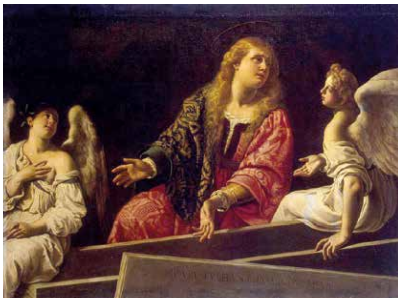
Antiveduto Gramatica, Maria Maddalena al sepolcro , San Pietroburgo, Ermitage

Il dipinto appartiene alla fase matura di Antiveduto Gramatica. Raffigura la Sibilla Egizia, da identificarsi con la Sibilla Libica. Le Sibille erano vergini votate a un idolo (solitamente Apollo), che vivevano in grotte e profetizzavano sul futuro, in "trance", per lo più in forma oscura. Benché pagane, Dio diede agli antichi, per mezzo loro, impressionanti profezie sull'Incarnazione di Dio in terra. Sono diciassette le Sibille, tutte d'epoca antica (dal 1500 a.C. fino alla nascita di Gesù Cristo), che vengono ricordate dalle fonti. Il nome stesso di Sibilla indica la "volontà del dio", e-