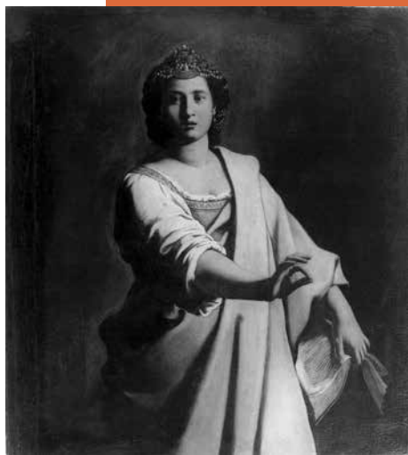
Antiveduto Gramatica, la musa Polimnia , Torino, Palazzo Chiablese